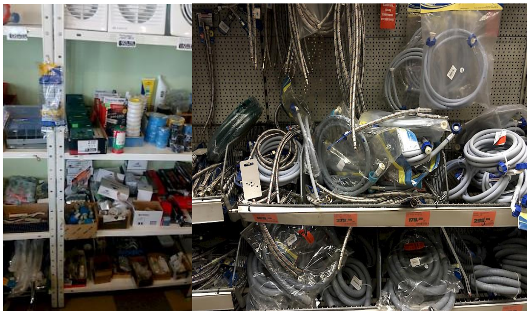
Рис.3. – Фото выкладки строй- и хозматериалов

Внимательно изучите фото 1 и 2. Назовите основные ошибки в выкладке представленных товаров.