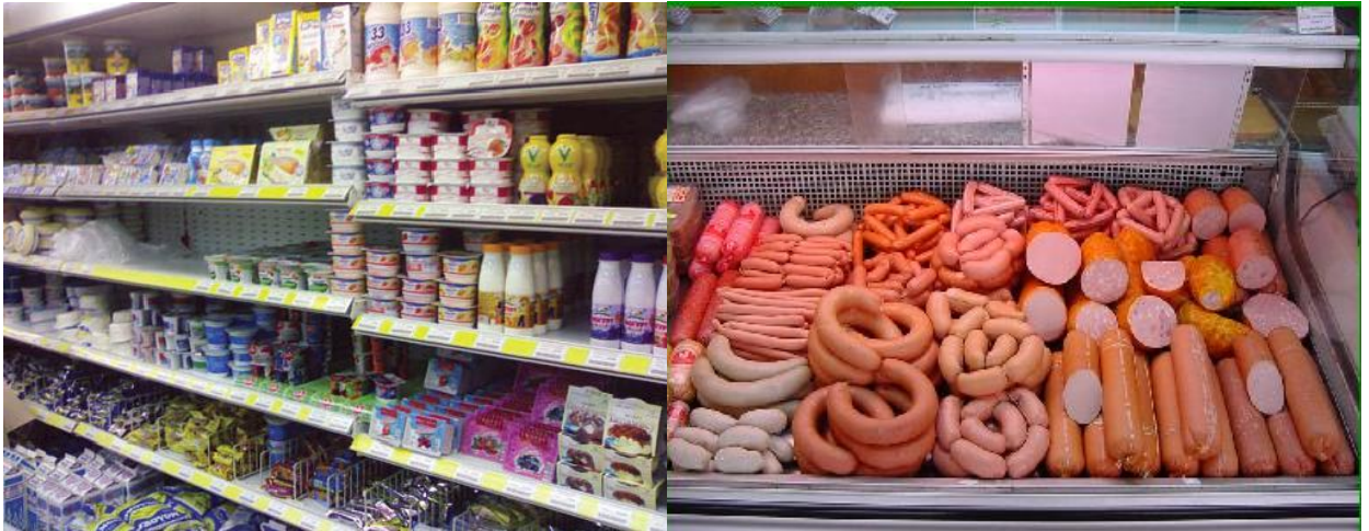
Рис.2. – Фото прилавков с молочными продуктами и мясными изделиями Задание 2

На примере существующего магазина, назовите преимущества и недостатки в выкладке следующих товаров (выбор по желанию студента): замороженных продуктов, плодоовощной продукции, напитков.