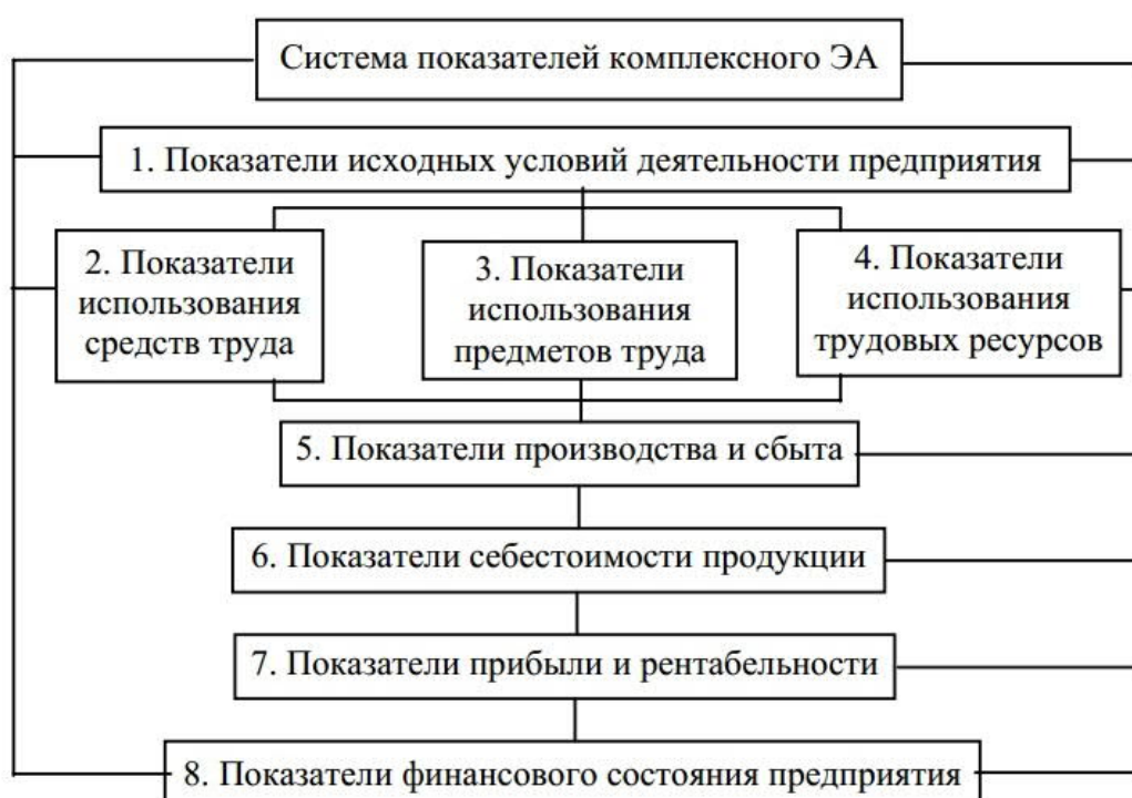
Рис. 2.1. Система показателей комплексного анализа хозяйственной деятельности

Графическое представление статистических данных, наглядно показывающее соотношение между ними, называется диаграммой. По форме строения диаграммы делятся на линейные, плоскостные и изобразительные. Чаще всего в курсовой работе используют линейные, а из плоскостных – столбчатые и круговые диаграммы.