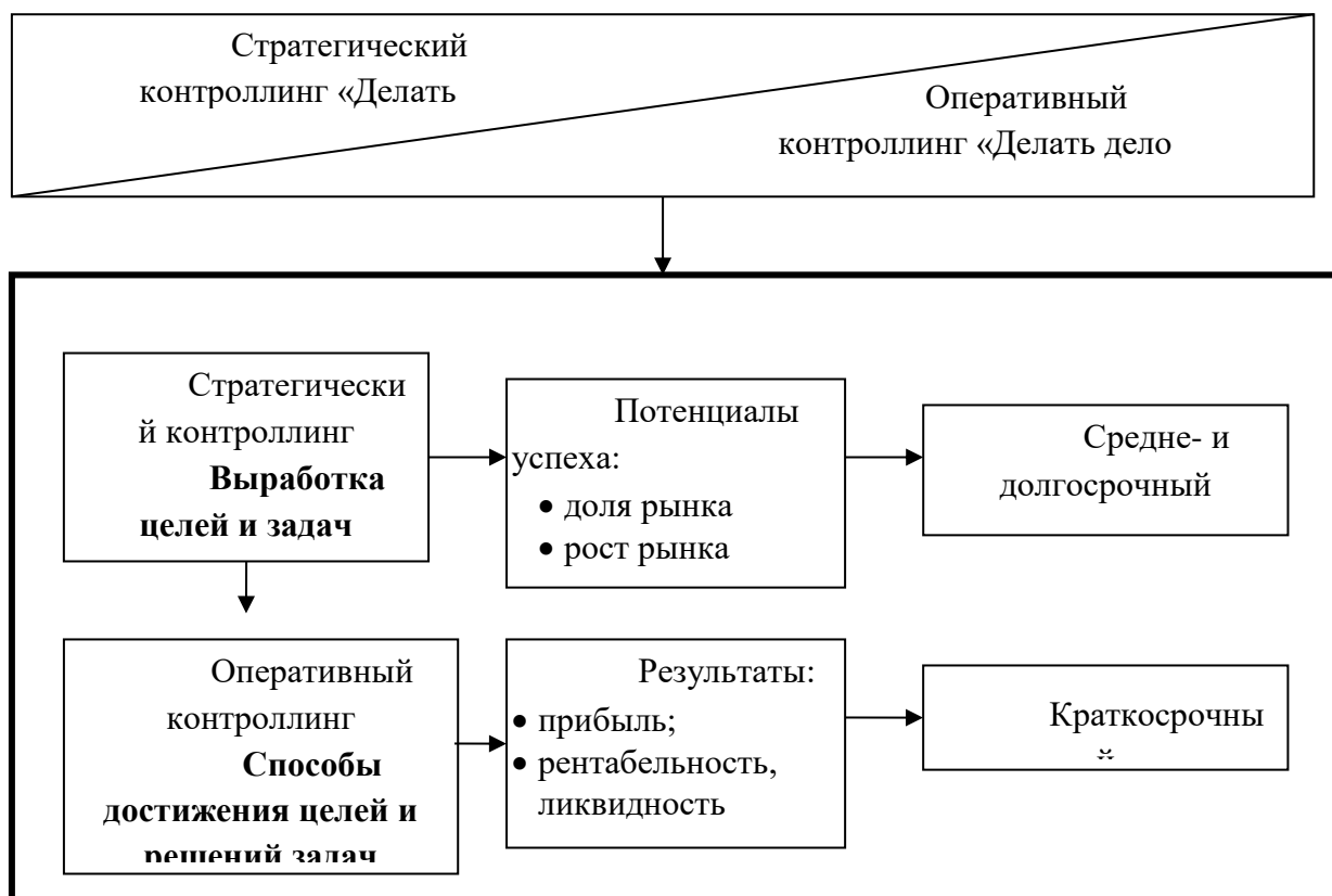
Рис. 1. Разграничение стратегического и оперативного контроллинга

Задание 2. Охарактеризовать отличия стратегического и оперативного контроллинга, используя характеристики на рис. 1.