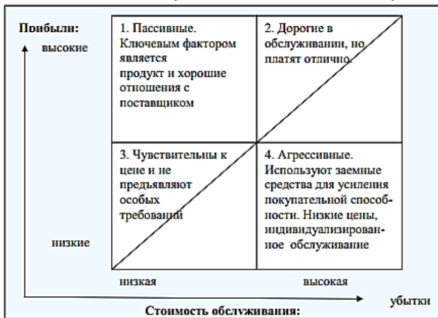
Рис. 1. - Матрица «Прибыль - стоимость обслуживания клиента»

Вопросы и задания. Представьте классификацию клиентов по их прибыльности, расположив их в один из четырех квадратов матрицы «Прибыль - стоимость обслуживания клиента». Обоснуйте свои решения.