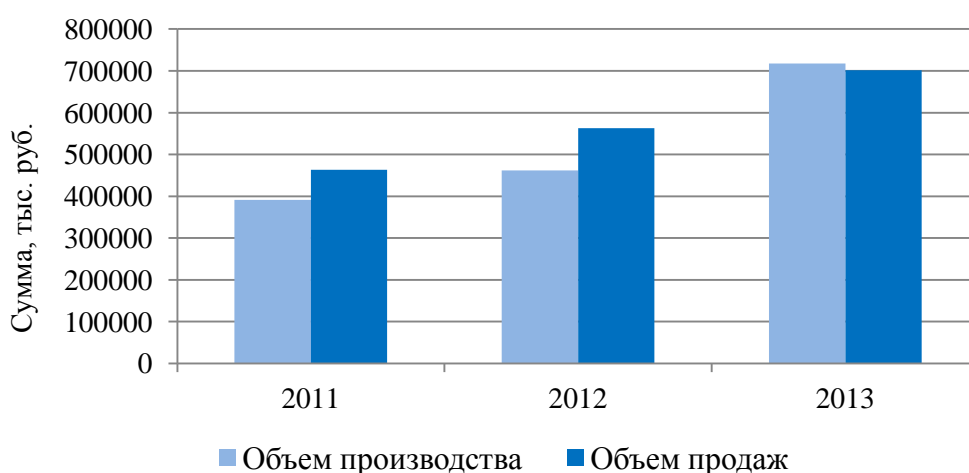
Рис. 2.2. Динамика производства и продаж товаров