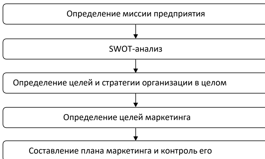
Рис. 1.2. Второй рисунок первой главы.

5.3.3. Иллюстрации обозначают словом (рис.) и нумеруют последовательно в пределах главы, за исключением иллюстраций в приложениях. Номер иллюстрации должен состоять из номера главы и порядкового номера иллюстрации, разделенных точкой: например, Рис. 1.2. – второй рисунок первой главы. Номер иллюстрации, ее название и пояснительные подписи размещают последовательно под иллюстрацией по центру.