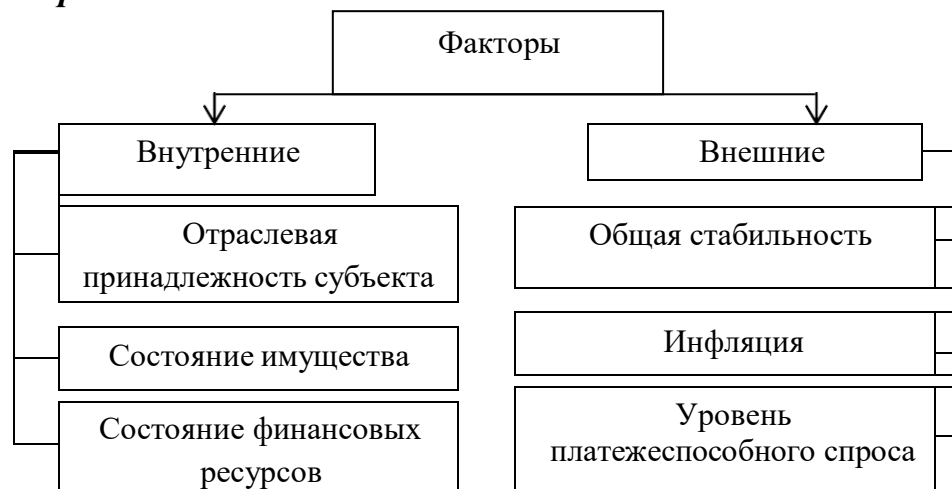
Рис. 1.2. Факторы, влияющие на финансовую устойчивость предприятия

Таблицы нумеруют последовательно в пределах глав (за исключением тех, которые размещены в Приложениях). В правом верхнем углу размещают надпись: «Таблица» с указанием ее номера, который состоит из номера главы и порядкового номера таблицы, разделенных точкой: например, Таблица 2.3 (третья таблица второй главы). Название таблицы размещается ниже, по центру страницы.