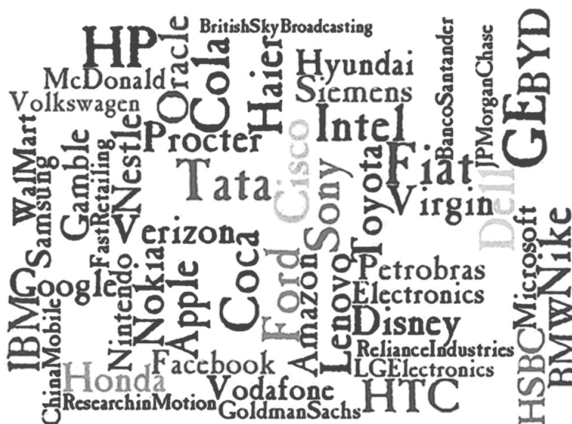
Рис. 1. Список 50 наиболее инновационных компаний 2010 г. по версии компании BCG и журнала BusinessWeek

Проанализируйте инновации, внедренные компаниями из списка 50 наиболее инновационных компаний 2010 г. или любой другой компанией, которая, на ваш взгляд, является инновационной. Опишите сущность нововведений и ключевые факторы, определившие успех продукта компании на рынке. Проанализируйте инновации с точки зрения уровня новизны (базисные, улучшающие, псевдоинновации), сферы распространения (глобальные, национальные, региональные, локальные, точечные), а также времени выхода на рынок (инновации-лидеры и последователи).