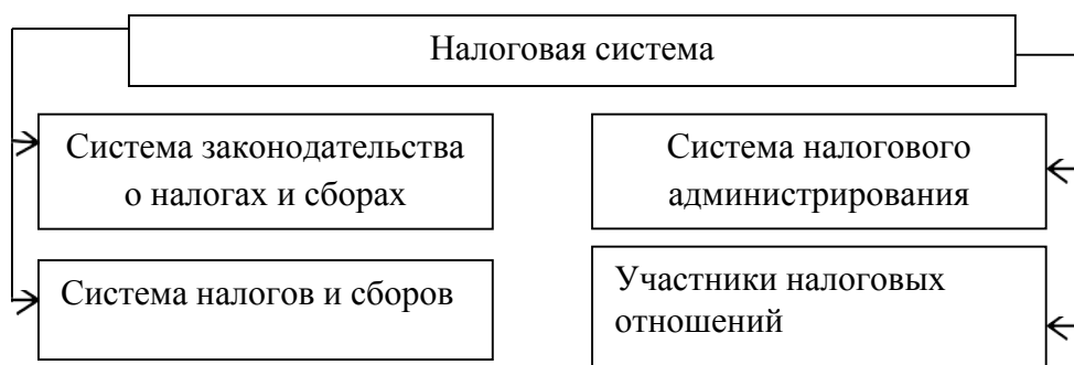
Рис. 1.2. Второй рисунок первой главы

Если иллюстрация заимствована или рассчитана по данным статистического ежегодника или другого литературного источника, надо обязательно делать ссылку на первоисточник. Допускается применять размер шрифта в иллюстрации меньший, чем в тексте (но не менее 12 кегля). Допускается применять одинарный междустрочный интервал.