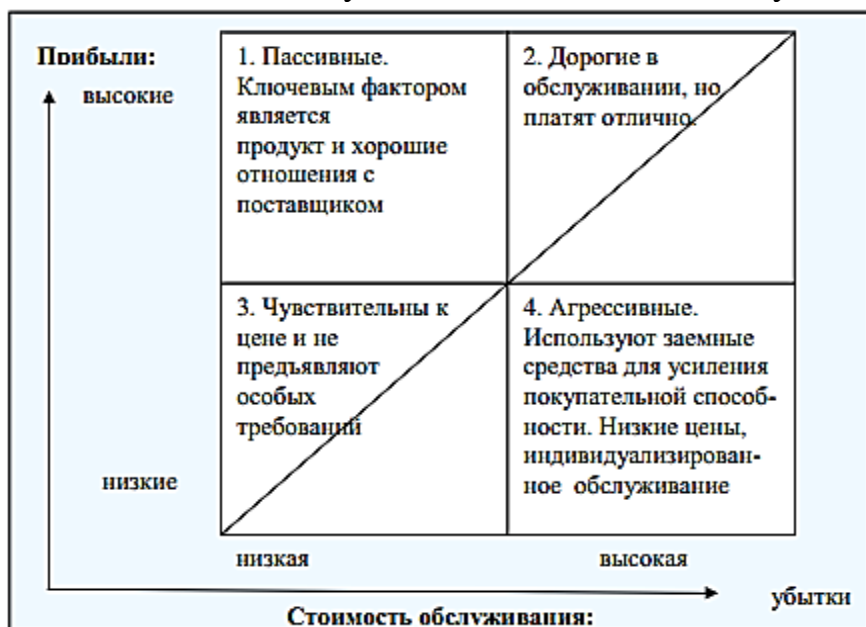
Рис. 1. - Матрица «Прибыль - стоимость обслуживания клиента»

Вопросы и задания. Представьте классификацию клиентов по их прибыльности, расположив их в один из четырех квадратов матрицы «Прибыль - стоимость обслуживания клиента». Обоснуйте свои решения.