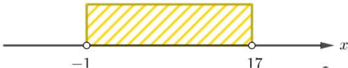
Рис. 4. Координатная ось

Задание 12. Напишите программу, которая принимает целое число x и определяет, принадлежит ли данное число указанному промежутку.