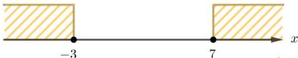
Рис. 6. Координатная ось

Задание 14. Напишите программу, которая принимает целое число x и определяет, принадлежит ли данное число указанным промежуткам.