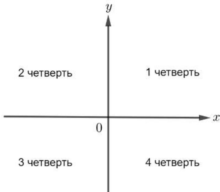
Рис. 3. Координатная ось

Задание 11. Напишите программу, которая по координатам точки, не лежащей на осях координат, определяет номер координатной четверти, в которой она находится.