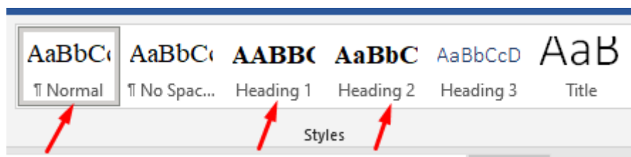
Рис.1. Стили, которые необходимо определить перед началом работы

Автором в обязательном порядке перед началом работы должны быть определены три стиля: Обычный , Заголовок 1 и Заголовок 2 (рис.1).