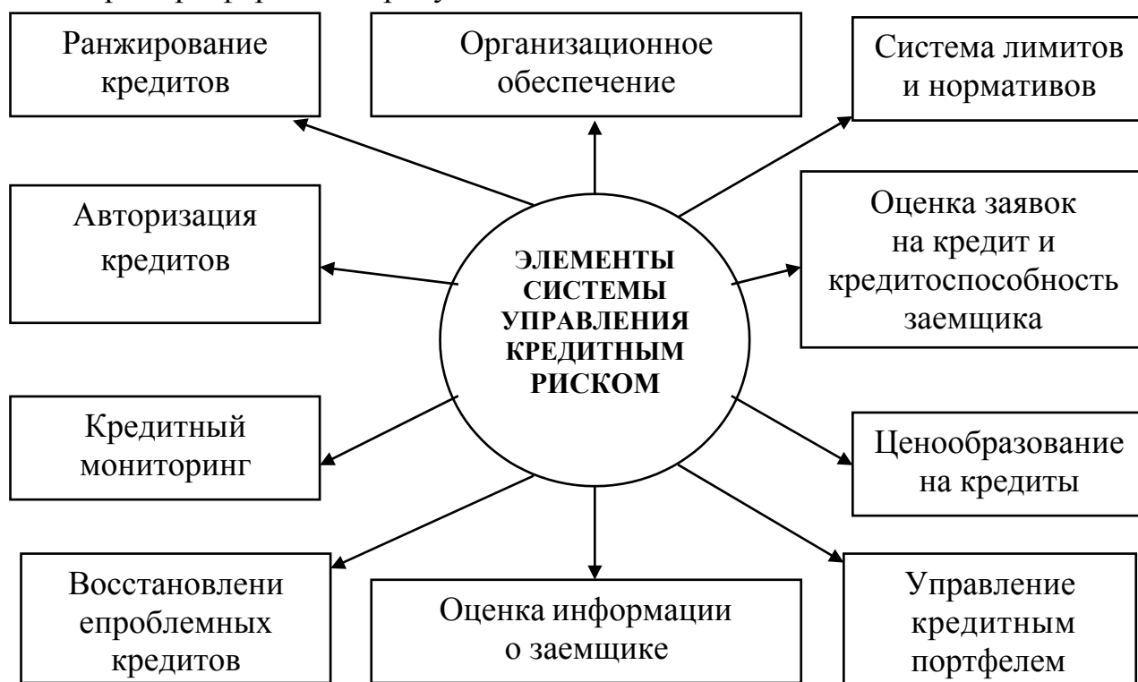
Рис. 2.2. Элементы системы управления кредитным риском