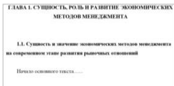
Рис. 5.2. Пример оформления заголовков в дипломной работе

Расстояние между заголовком структурных частей работы и текстом, а также между названием главы и заголовком параграфа должно составлять 2 интервала основного текста. Расстояние между заголовком параграфа и текстом должно составлять 1 интервал основного текста (рис. 5.2.).