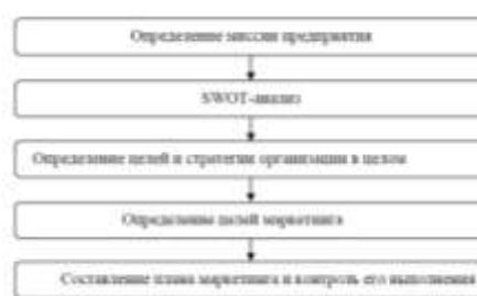
Рис. 1.2. Процесс планирования маркетинга на предприятии

5.3.3. Иллюстрации обозначают словом (рис.) и нумеруют последовательно в пределах главы, за исключением иллюстраций в приложениях. Номер иллюстрации должен состоять из номера главы и порядкового номера иллюстрации, разделенных точкой: например, рис. 1.2. – второй рисунок первой главы. Номер иллюстрации, ее название и пояснительные подписи размещают последовательно под иллюстрацией по центру.