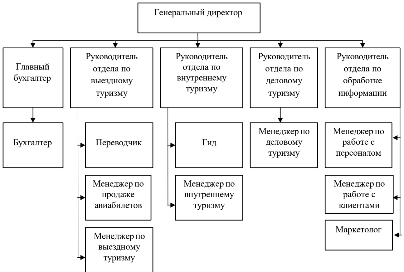
Рис. 1.1. Организационная структура управления туристической фирмой