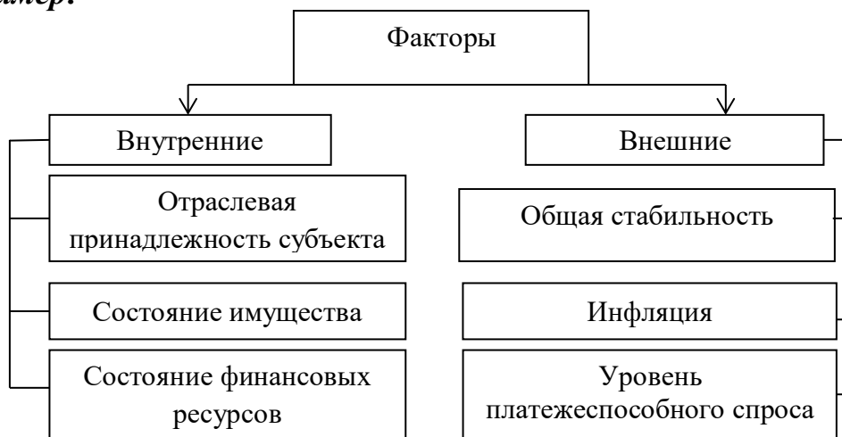
Рис. 1.2. Факторы, влияющие на финансовую устойчивость предприятия