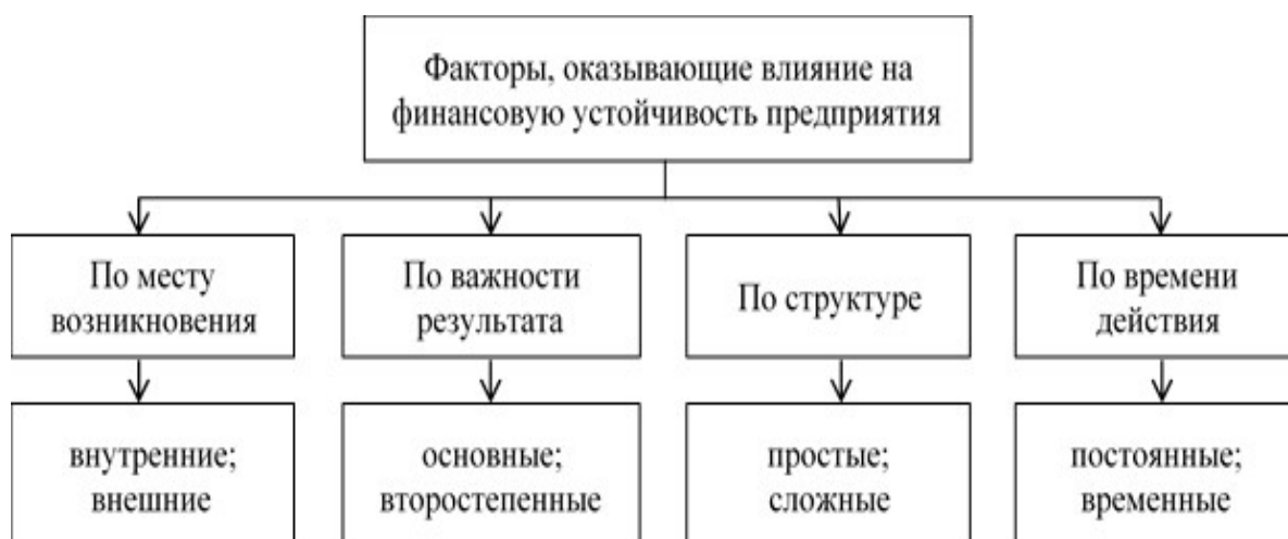
Рис. 4.1 Классификация факторов, влияющих на финансовую устойчивость предприятия