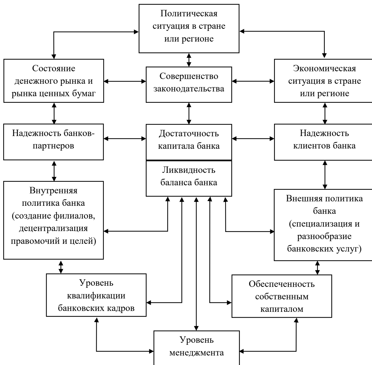
Рис. 2.5. Взаимосвязь ликвидности и достаточности капитала