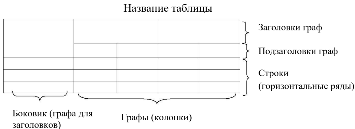
Рис.1.1. Структура и вид таблицы