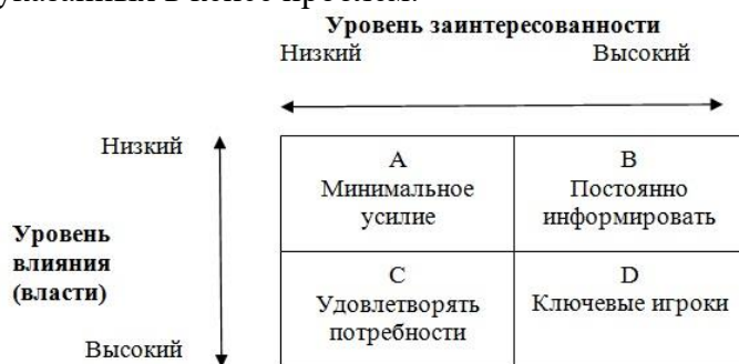
Рис.1. Матрица «Сила-Интерес»

Задание. Определите ключевых стейкхолдеров компании и их основные интересы, выделите наиболее влиятельных из них. Проведите анализ заинтересованных сторон с использованием матрицы «сила—интерес». Определите основную стратегию взаимодействия компании со стейкхолдерами и подберите наиболее адекватные инструменты, с учетом указанных в кейсе проблем.