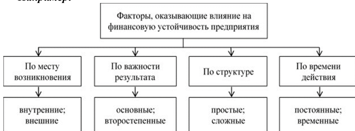
Рис. 1.2. Классификация факторов, влияющих на финансовую устойчивость предприятия