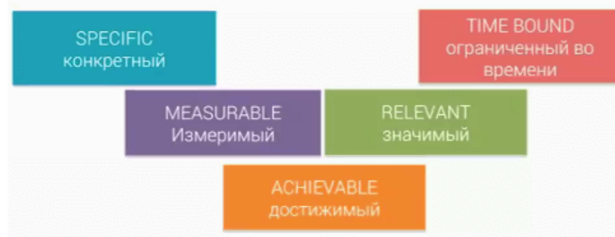
Рисунок 1 – Критерии целей по модели Smart

То есть цели должны быть конкретными, измеримыми, значимыми для бизнеса, достижимыми и ограниченными по времени. Исходя из этих критериев, определяются цели для сайта.