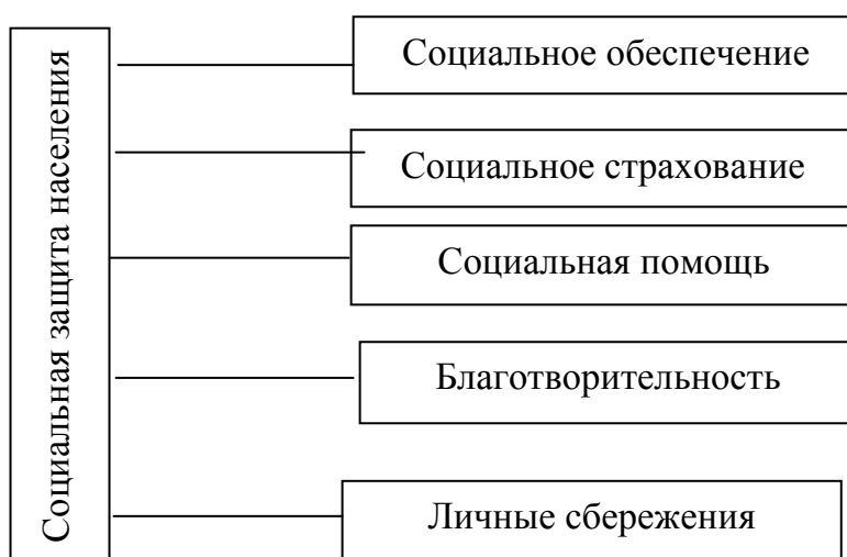
Рис. 1. Структура социальной защиты населения [3].

Схематично структура социальной защиты населения, представлена на рисунке 1.