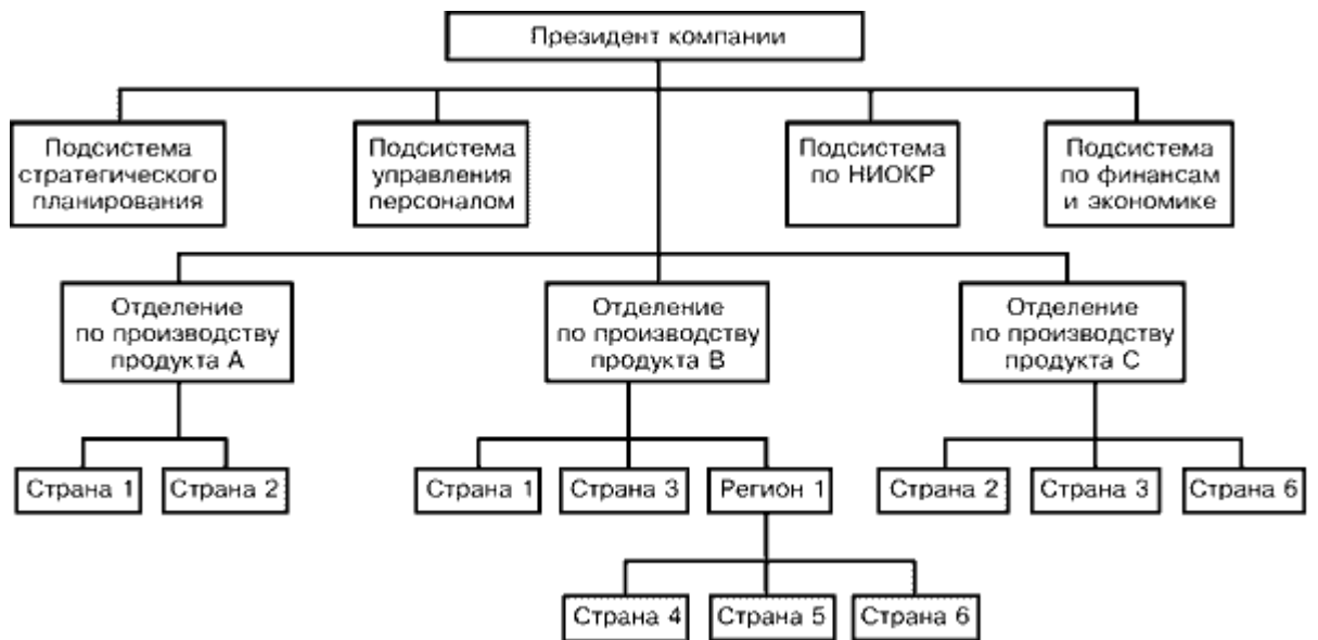
Рис.2.1. Глобально-ориентированная продуктовая (товарная) структура