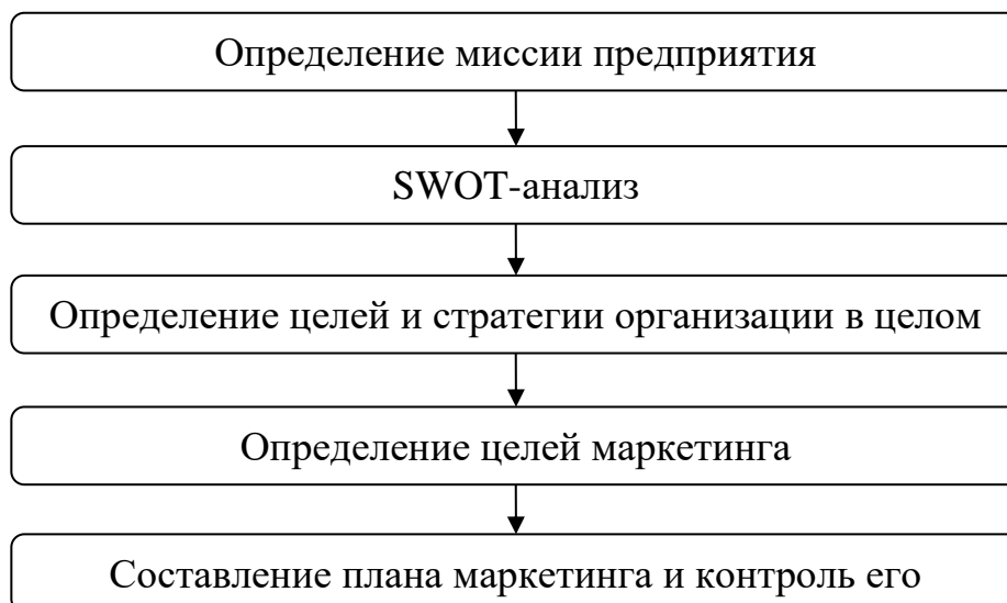
Рис. 1.2. Второй рисунок первой главы