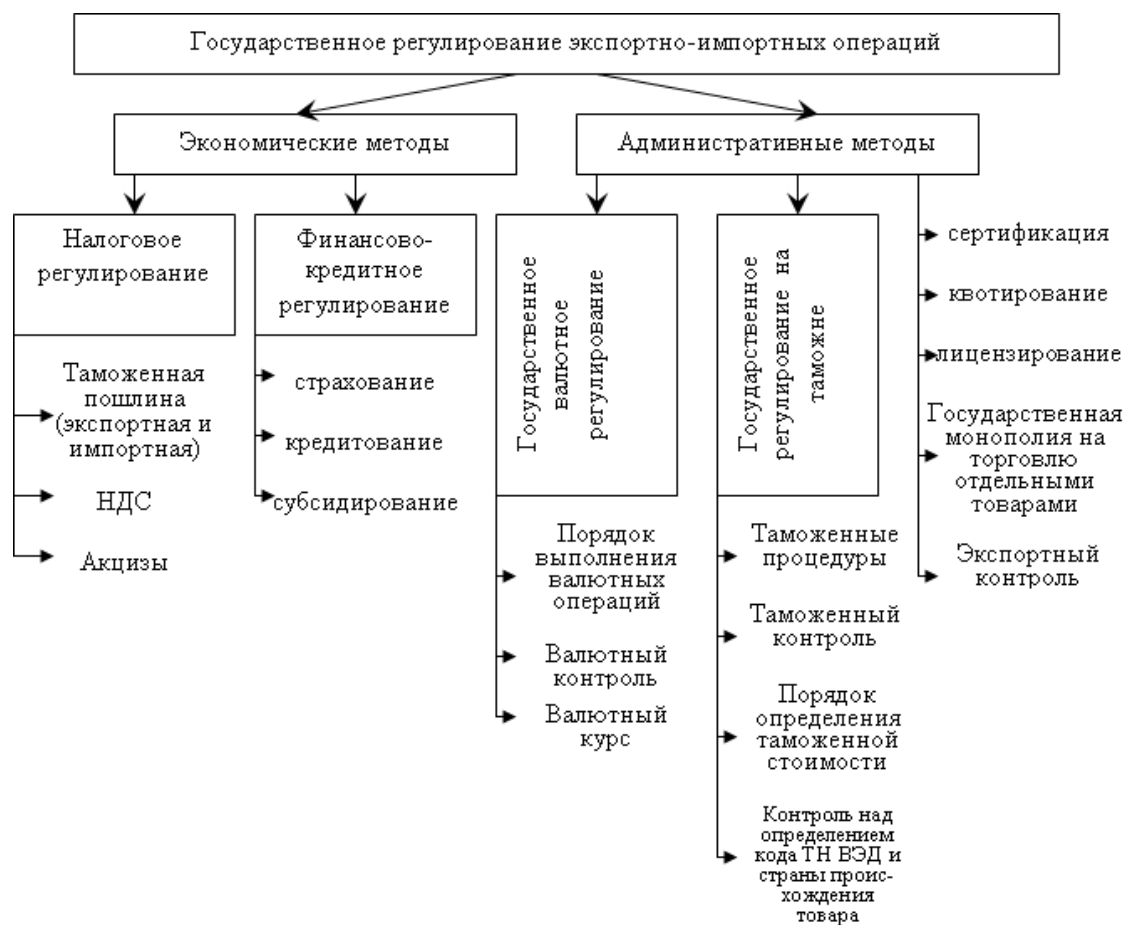
Рис. 1.3. Методы государственного регулирования экспортно-импортных операций