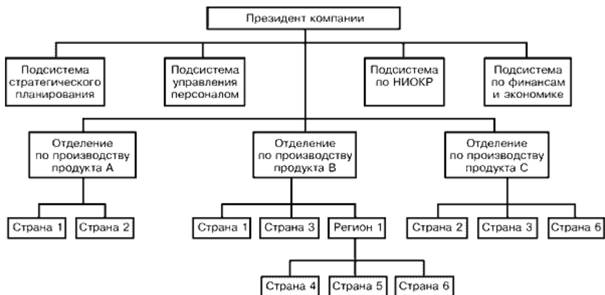
Рис.2.1. Глобально-ориентированная продуктовая (товарная) структура