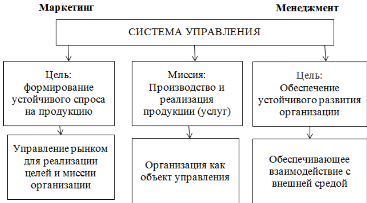
Рис. 1.3. Место маркетинга в системе управления

Иллюстрации (схемы, графики и т.п.) и таблицы следует подавать в работе непосредственно после текста, где они упомянуты впервые, или на следующей странице. Если они содержатся на отдельных страницах дипломной работы, их включают в общую нумерацию страниц. Иллюстративные или табличные материалы, размеры которых превышают формат А4, размещают в приложениях. На все иллюстрации должны быть ссылки в тексте.